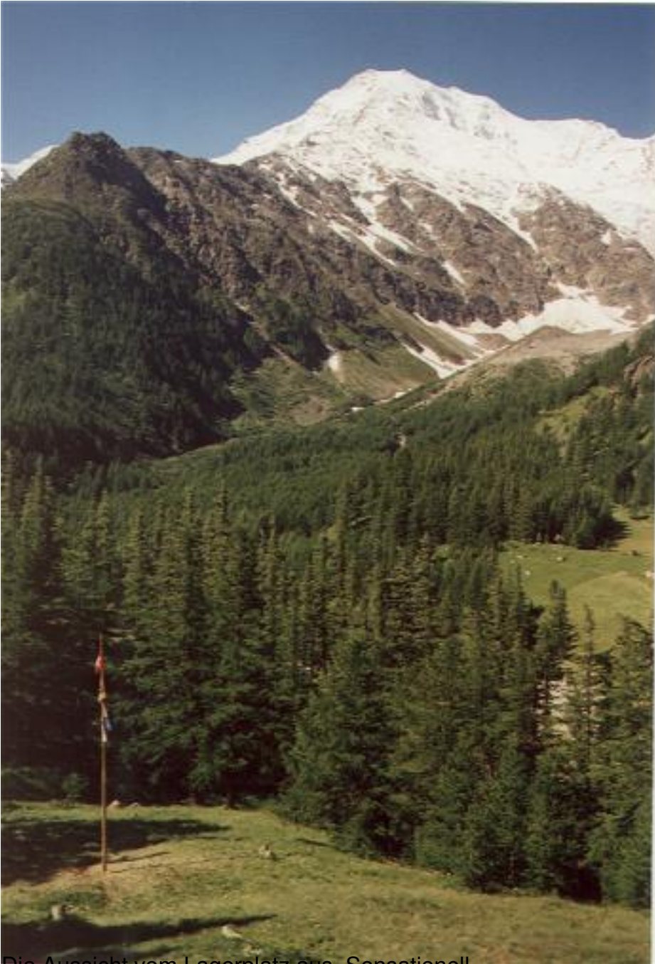
Die Aussicht vom Lagerplatz aus. Sensationell